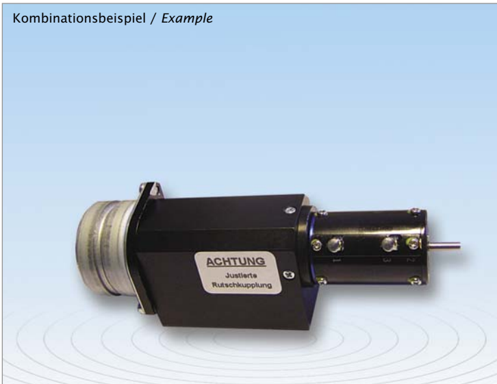
Kombinationsbeispiel / Example